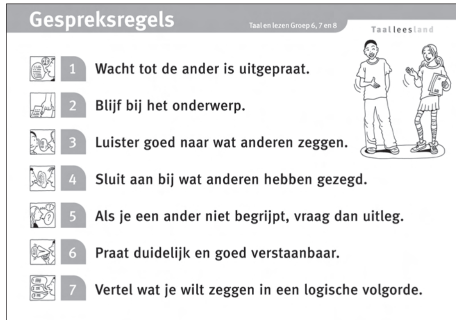
Klassikale kaart Gespreksregels

In al deze lessen gaat het primair om de introductie en verkenning van het nieuwe thema. Hierbij wordt geluisterd naar een voorgelezen verhaal dat het thema inleidt of naar enkele korte spreekbeurten. Naar aanleiding hiervan wordt een gesprek gevoerd en ingegaan op ervaringen van leerlingen en vragen van de leerkracht over het thema. In groep 4 en 5 worden hierbij systematisch luister- en spreekvaardigheden aangeleerd in de vorm van gespreksregels.