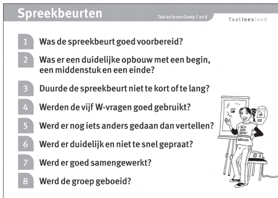
Klassikale kaart Spreekbeurten

Zie tabel 1 en 2 voor een overzicht van de spreekbeurten.